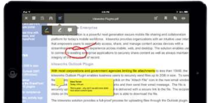
Integrierter kiteworks Mobile-Editor